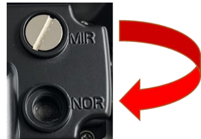
Rückseite der Kamera