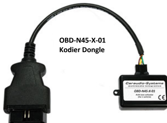
OBD-N45-X-01 Kodier Dongle