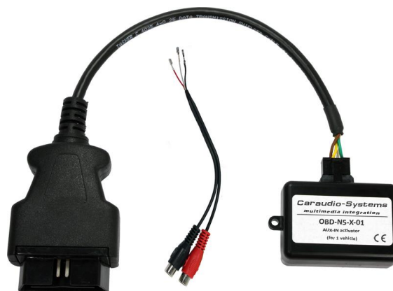
OBD-N5-X-01 Kodier Dongle